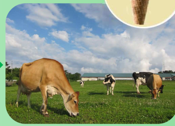
くろべ牧場まきばの風