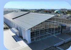
YKKAP技術館 ※月曜・祝日定休