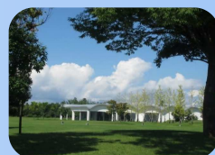
YKKセンターパーク ※月曜定休