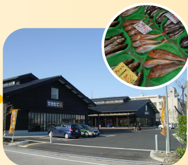
魚の駅「生地」※水曜定休